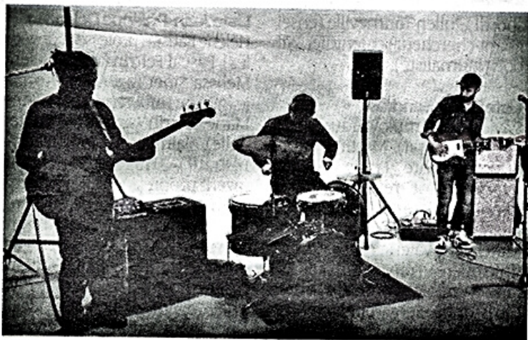
Le trio Lucky Pepper and the Santa Fellas débarque ce soir à la Belle Lurette. PHOTOS D.